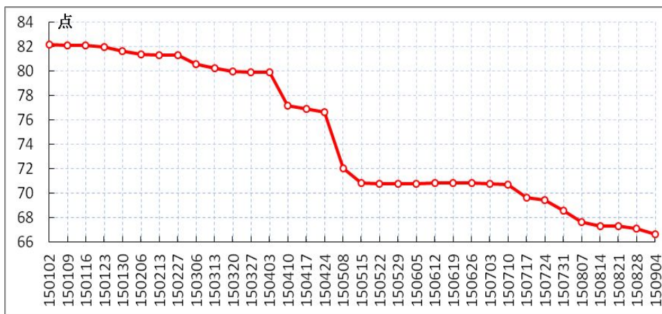
图 1 中国太原煤炭交易综合价格指数走势图

☞本期中国太原煤炭交易综合价格指数为 66.64 点，环比下跌 0.43 点，较年初下降 15.5 点。（见图 1）