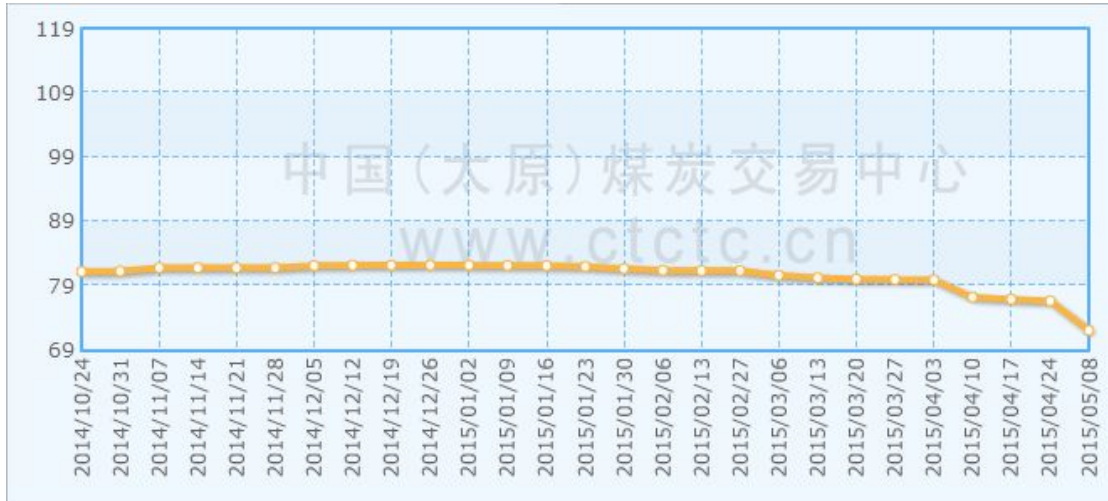
图1 中国太原煤炭交易综合价格指数走势图

3. 动力煤：本期大同、忻州、长治等地动力煤车板价大幅下跌，阳泉地区下跌幅度明显，朔州地区暂时维稳。